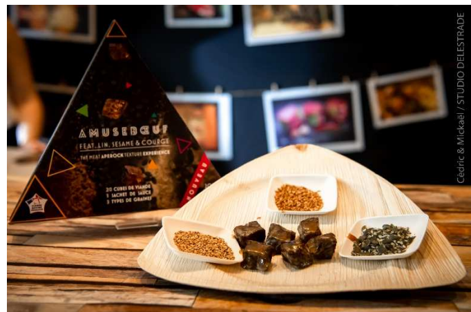
Amuse-Bœuf, ECOTROPHELIA France Innovation Viande 2019 ESIX, École d'Ingénieurs Université de Caen.

En réponse aux enjeux de l'alimentation du futur et aux problématiques des industries alimentaires, ECOTROPHELIA organise la 21 ème édition de son concours national en collaboration avec l'ANIA (Association Nationale des Industries Alimentaires), les grandes écoles, universités et instituts de recherche, et les filières professionnelles INTERFEL (Interprofession Fruits et Légumes frais), INTERBEV (Interprofession de l'Élevage et des Viandes) et France FILIÈRE PÊCHE (Interprofession Pêche maritime).